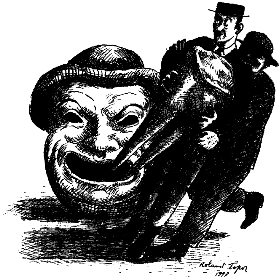
Disegno di Roland Topor