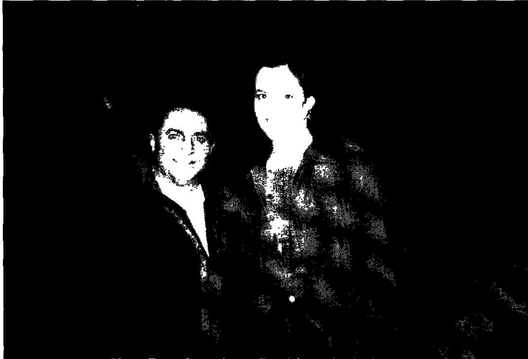
Alfredo Colombaioni e Sigourney Weaver