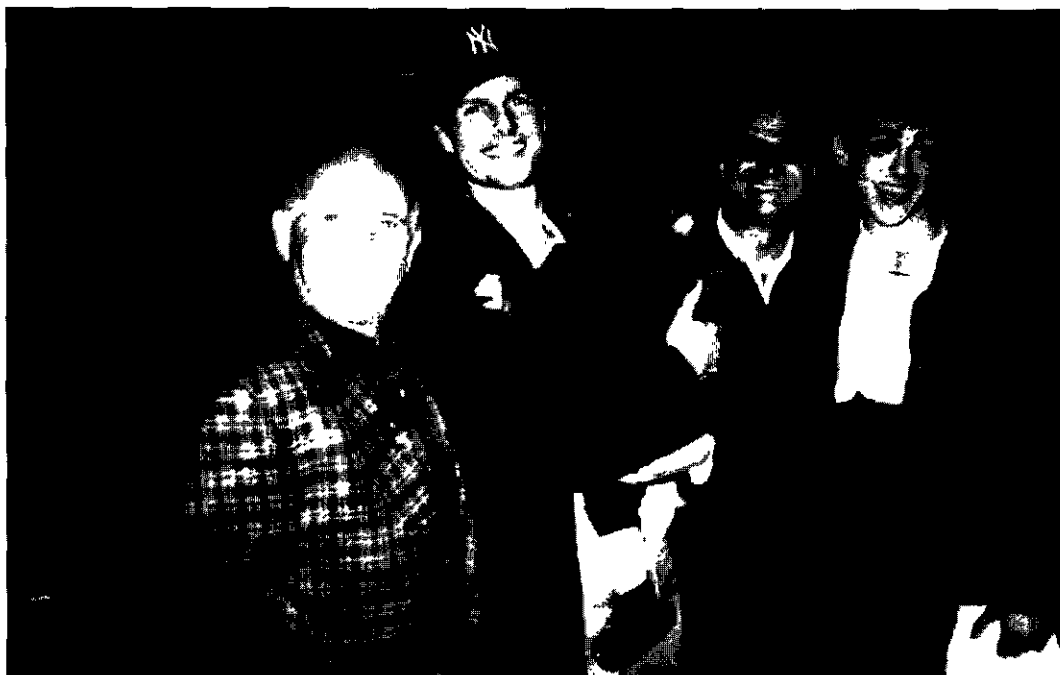
Romano e Alfredo Colombaioni con Tom Cruise al Big Apple Circus di New York